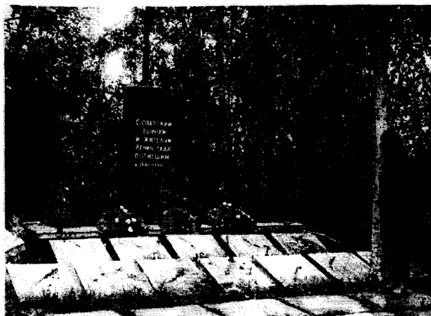
Братская могила, где похоронена мама. с. Кобана, Советским войскам и жителям Ленинграда погибшим в 1941-1944гг. Фото 1983г.

Ко мне подошла медсестра и спросила: «Есть ли у меня вещи?». Я сказала, что они на улице. Она послала меня до них и сказала, чтобы я их не оставляла, а то и здесь умрешь от голода. Я пошла. Вещи были целы, а когда вернулась, мамы на койке не было, её уже убрали. Мама похоронена в братской могиле с. Кобона.