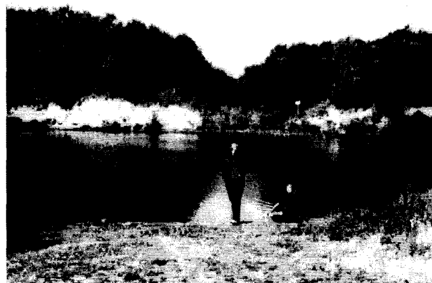
С.Кобана. место, где была высадка Ленинградцев с машин. Фото 1983г.

Я осталась одна. Осталась на улице, без крыши над головой.